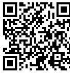
澎湖環境教育曉天下 FB 社團