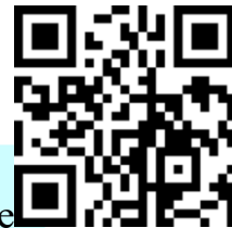
報名連結 QR Code